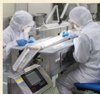
衛生管理・ 品質確認・ 各種検査