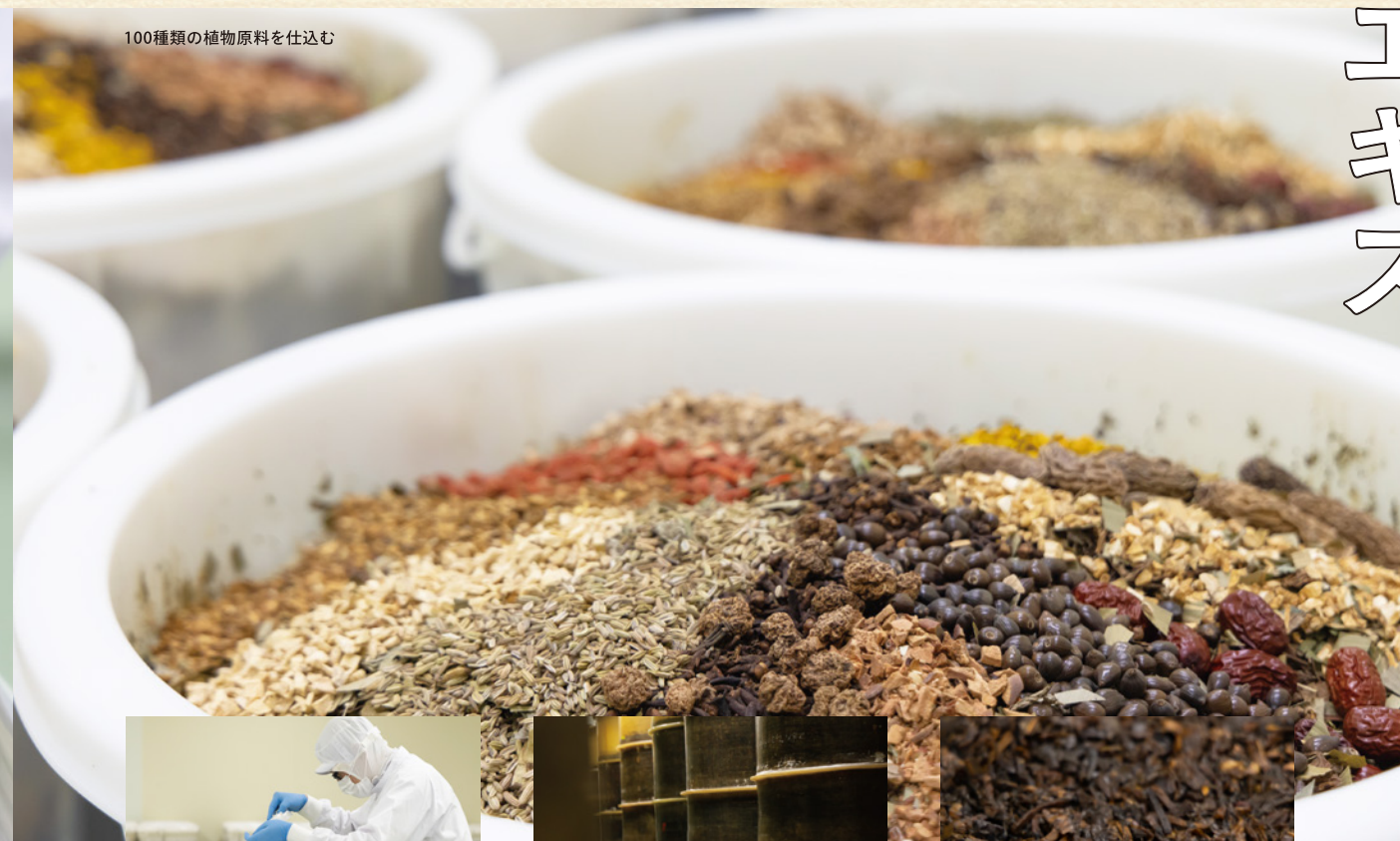
100種類の植物原料を仕込む