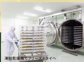
凍結乾燥機でフリーズドライへ