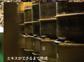
エキスができるまで熟成