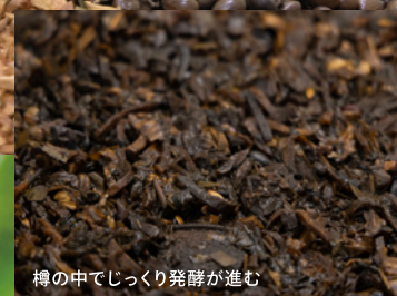
樽の中でじっくり発酵が進む