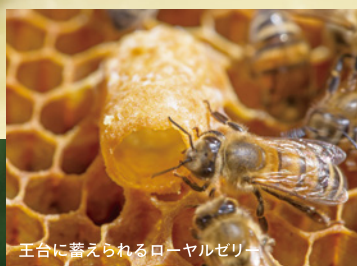
王台に暮えられるローヤルゼリー