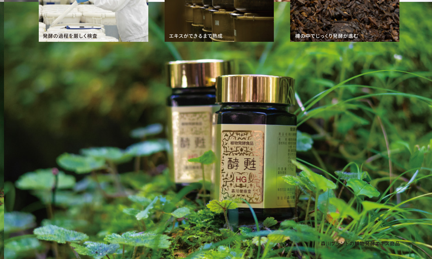
森川ブランドの植物発酵エキス商品