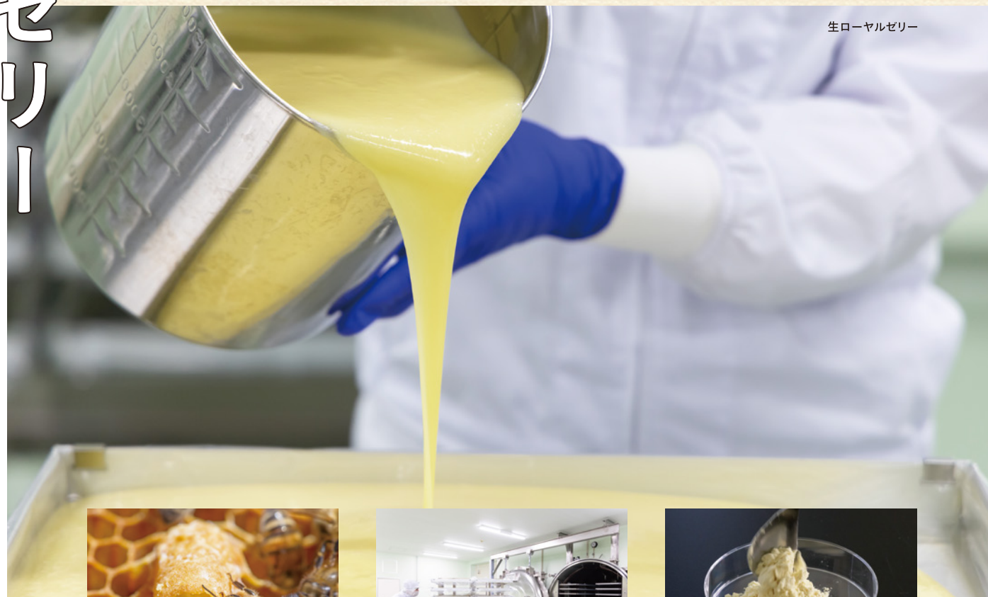
生ローヤルゼリー

※植物発酵エキスは発酵の管理が難しいため、原料の販売は致しかねます。弊社が責任を持って最終製品の形で納品いたします。