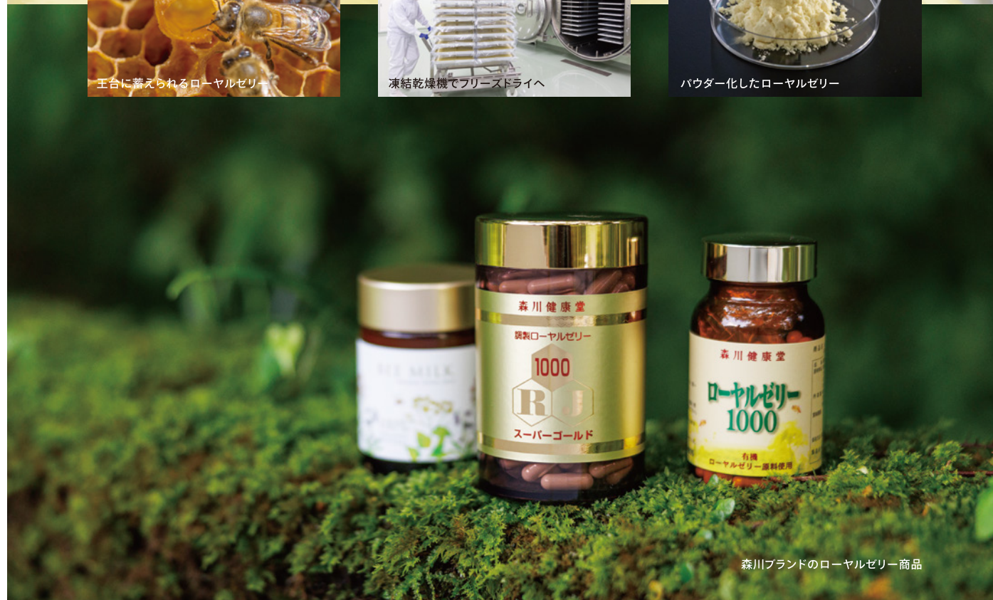
森川ブランドのローヤルゼリー商品