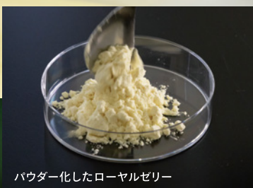
パウダー化したローヤルゼリー