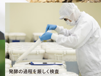
発酵の過程を厳しく検査